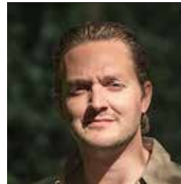
ATELIER PRO THIJS KLINKHAMER (INTERIEURARCHITECT)

1. Daar zijn wij het niet mee eens. Allereerst het ruimte-issue. Ontwerpen met 1,5m afstand waarborg is geen optie. Dan moeten gebouwen kolossaal worden en de klaslokalen heel groot. Dat is geen optie. Er moet meer nagedacht worden over hoe we de gebouwen gebruiken. Bijvoorbeeld voor het voortgezet onderwijs; geef instructie over het gebruik van de ruimte. Voor samenwerken en mentorgesprekken wel bij elkaar komen, waardoor je voor bezetting maar de helft van de gebouwruimte nodig hebt. Maar er zijn ook kansen voor het interieur; denk bij meubelkeuze na over materialisatie. Geen gebruik meer maken van stoffen of leer. Als schoonmaakbeleid de komende jaren zo blijft dan bijten de desinfecterende middelen in op de producten.