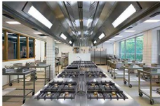
TEXST Rutger van Oldenbark

Voor het interieur van de onderwijsomgevingen, parkgebouwen en kantoren werd ZENBER gevraagd, dat het ontwerp maakte in intensieve samenwerking met de vakschool en de opleidingsinstellingen. Daarnaast deed ZENBER workshops met docenten over schoolelijke thema's als functionaliteit, gebruik en gebruik, en met leerlingen over de 'look & feel'. Hier kwam onder meer uit dat de docenten vroegen om inspiratie en